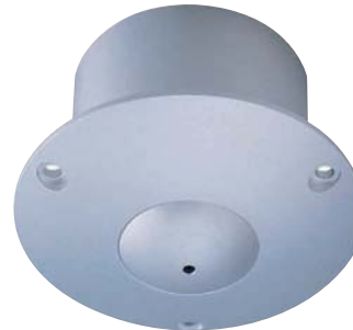
● Montaż podtynkowy