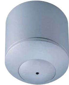
● Montaż powierzchniowy