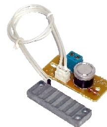
GRZAŁKA 12V, 230V